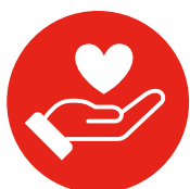
5. COACHEN, ONDERSTEUNEN EN MOTIVEREN