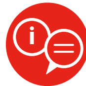
4. INFORMEREN EN ADVISEREN