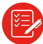
7. PLANMATIG EN SYSTEMATISCH WERKEN