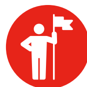
8. STAAN VOOR DE EIGEN PROFESSIE

Ieder cluster omvat competenties waarover een professional in sociaal-financiële dienstverlening dient te beschikken. Welke dat zijn hangt af van de rol, functie of het taakgebied van de professional, en van de situatie van hun cliënt. Dit laatste wordt inzichtelijk gemaakt met het Vaarwater financiële bestaanszekerheid.