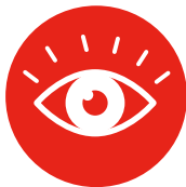
2. SIGNALEREN, INVENTARISEREN EN ANALYSEREN