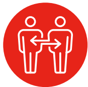
1. AANSLUITING VINDEN EN CONTACT AANGAAN

De beroepscompetentieset sociaal-financiële dienstverlening richt zich op het versterken van financiële bestaanszekerheid van mensen. De set is onderverdeeld in acht clusters: