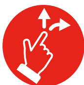
6. STUREN EN BEÏNVLOEDEN