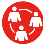
3. SAMENWERKEN EN OPEREREN IN EEN BELANGENVELD