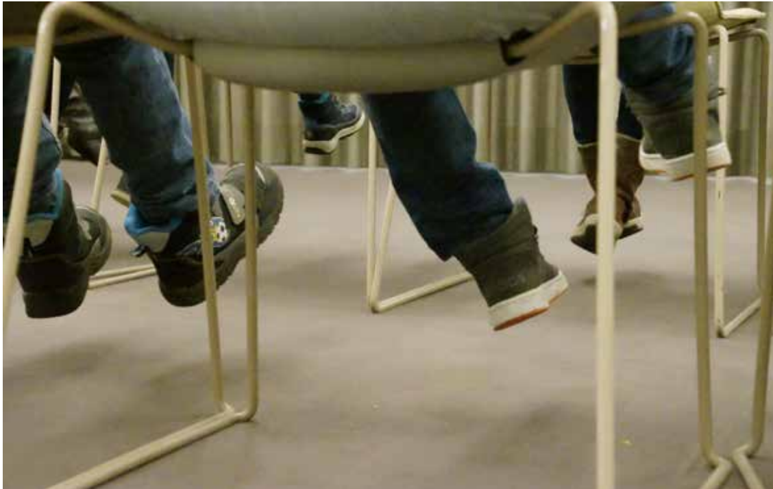
Afbeelding 3. In afwachting van een rondleiding bij de bank

Leren kan in een omgeving waar je je op je gemak voelt; waar mensen zich vrij voelen om vragen te stellen, te oefenen en feedback te horen. Daarom kun je niet alleen met de serieuze kant van de zaak bezig zijn. Het programma is niet het doel, maar het middel. En spontane, grappige momenten zijn hard nodig voor een fijne sfeer. Dat geldt ook voor iets lekkers bij de koffie. Typisch iets waar de ouders letterlijk en figuurlijk iets van zichzelf mee kunnen brengen. Hoeft niet, kan wel.