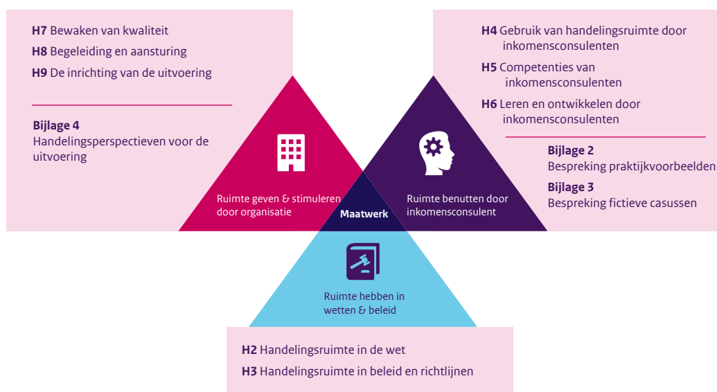
Figuur 3 Indeling van hoofdstukken en bijlagen naar de dimensies uit het model Ruimte voor maatwerk

Dit rapport is opgezet aan de hand van het model Ruimte voor maatwerk van De Vries en Hendriks (2025). In figuur 3 is te zien hoe de hoofdstukken zijn ingedeeld naar de drie dimensies. Ook is weergegeven bij welke dimensies bijlagen 2 t/m 4 thuishoren.